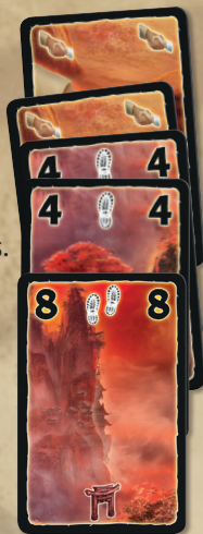
Cartes formant une expédition

Lorsque vous placez la première carte d'une couleur devant vous, elle commence l'expédition. Toutes les cartes de cette même couleur que vous jouerez ensuite devront être ajoutées à cette expédition. Lorsque vous ajoutez des cartes à une expédition, placez-les de manière légèrement décalée afin de pouvoir facilement lire leur valeur, comme illustré ci-contre.